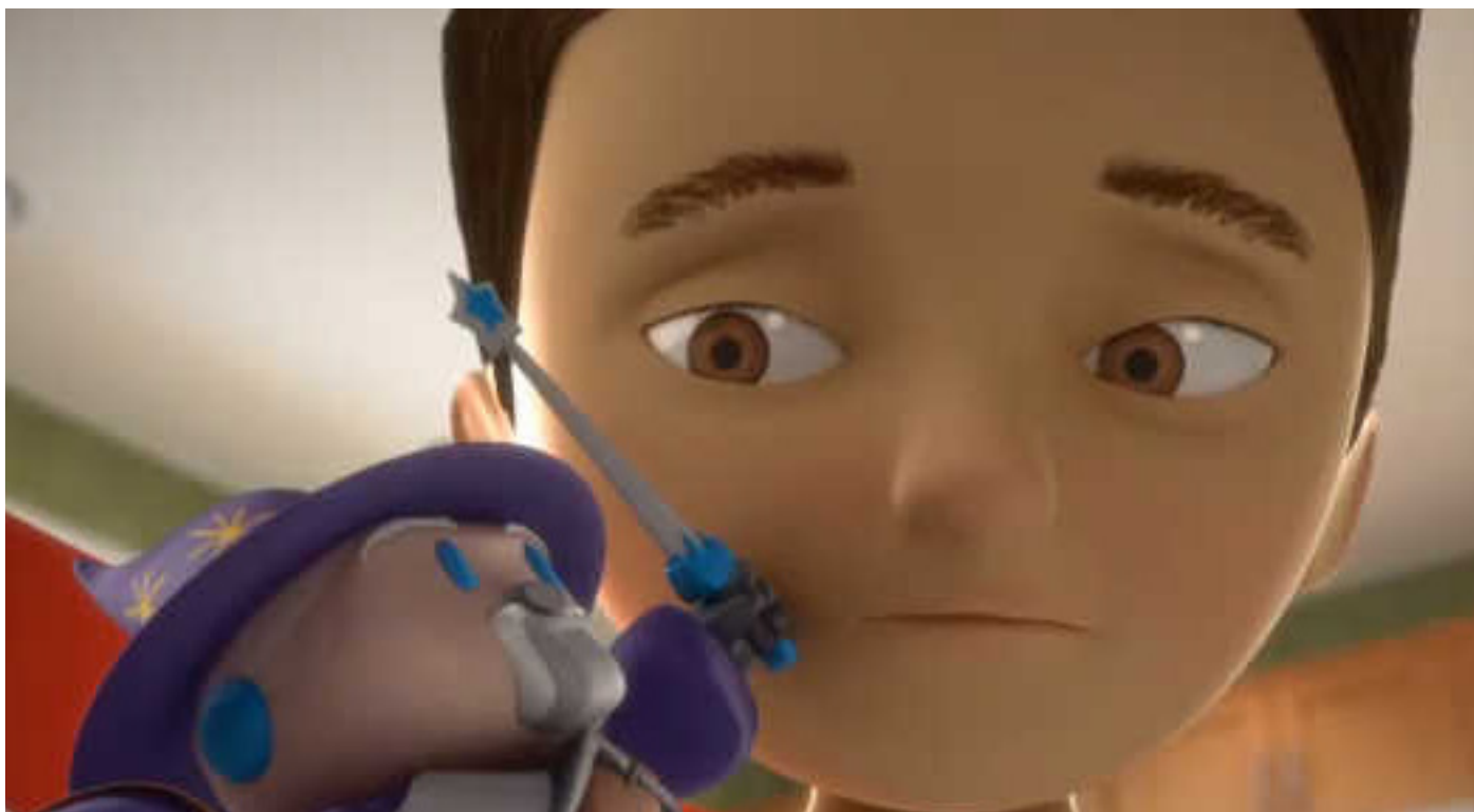
Vagttårnselskabet, Jehovas Vidner - DVD for børn 'Adlyd Jehova' mp4

Man spiller hverken Lotto, tombola eller hasard, ryger ikke, og galt er det, hvis man læser bøger om superhelte med magiske evner, for så gør man noget, Jehova ikke kan lide – klik på udklippet fra Ekko for at se hele omtalen.