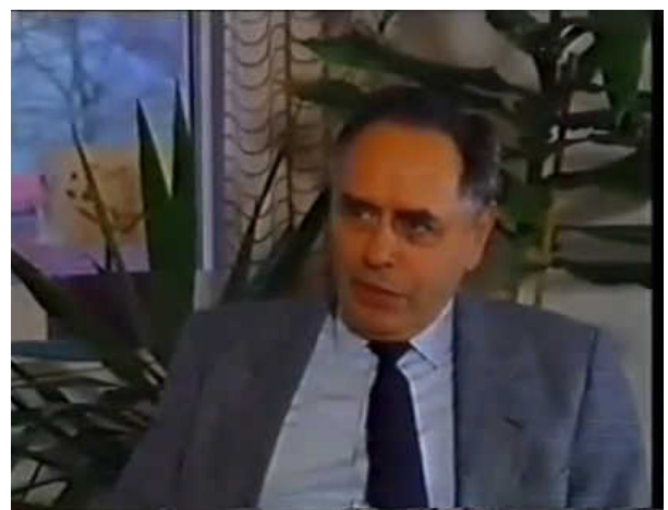
'Dømt til Døden'