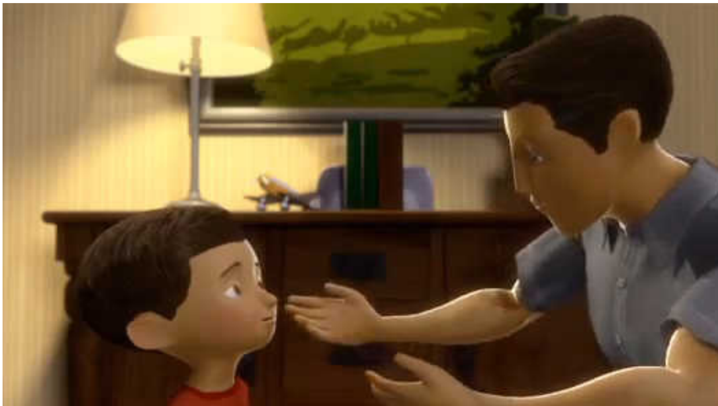
Vagttårnselskabet, Jehovas Vidners DVD for børn 'Adlyd dine forældre' mp4

opdragelsesmateriale. I DRs dokumentar fra 1991 oplyses om bogen 'Fra det tabte Paradis, til det genvundne Paradis', som i meget voldsomt billedsprog beskriver omstændighederne ved Harmagedon-slaget. Bogen oplyses at blive brugt til undervisning af børn.