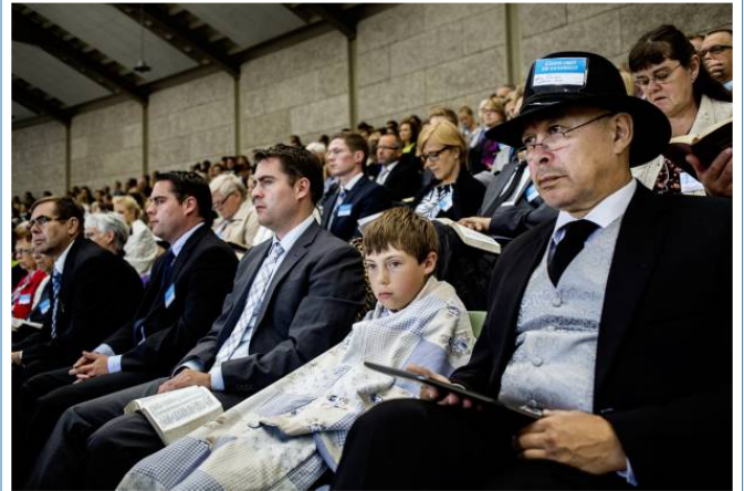
DÅB. En dreng varmer sig med et håndklæde efter sin dåb på sit weekends sommertræf i Jehovas Vidner.