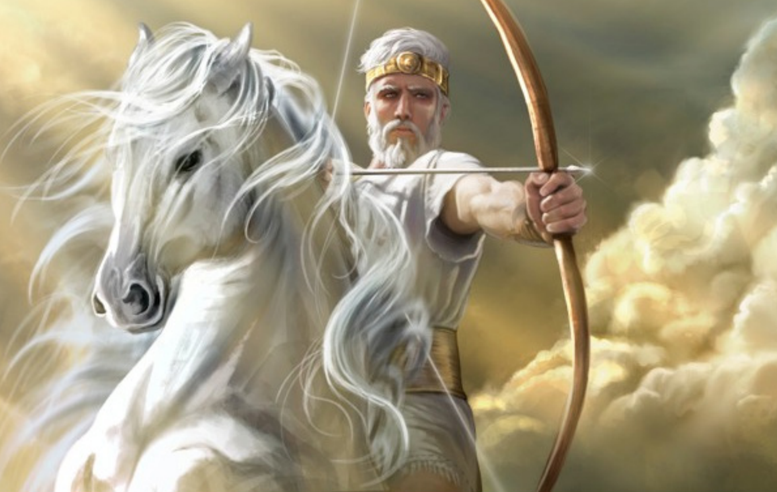
Den hvide rytter, Jesus, der vinder Harmagedon-slaget. Vagttårnselskabet. Klik på foto for at se udlægningen af profetien i Johannes Åbenbaring.

Nogen vil mene, at små Jehovas Vidner under oplæring til overmål får oplevelser af typen, der findes i eventyrfilm som for eksempel 'Ringenes Herre' og 'Hobbitten'. Problemet er selvsagt, at Tolkien er en fascinerende fantasi, som voksne og børn kan dele og grine væk, når de går