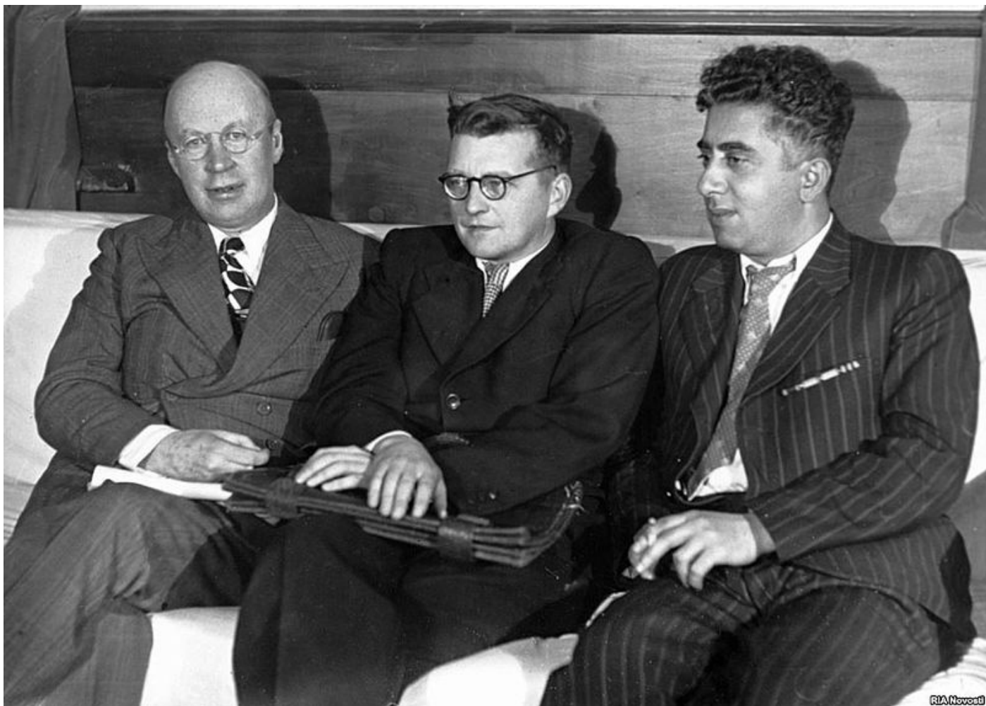
From left to right: Sergei Prokofiev, Shostakovich, Aram Khachaturian, 1945

kampen imod nazismen. I ideologiernes duel soledet Sovjetstyret sig lidt i vestens begejstring for de udsmyglede værker imod nazismen, der faldt for russernes hånd, men fandt alligevel symfoni nummer 8 unødvendigt pessimistisk, al den stund at Sovjet jo var på vej til sejr.