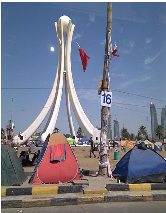
Pearl Pladsen i Bahrain før og efter det arabiske forår

the state' er i Saudi Arabien en meget snæver definition af Islam. Det så verden kontant eksempel på, da Saudi Arabien kom Bahrain militært til undsætning for at få standset shiitiske demonstrationer på 'Pearl Pladsen' i hovedstaden. Bahrain udviste ligeså kontant bevidsthed om betydningen af visuel identifikation. Man indså, at det kunstneriske monument, som før havde været en national æstetisk stolthed, i lang tid fremover ville knytte til sig billederne af Bahrains undertrykkelse af frihed til at tro og tale. Man fjernede det kunstneriske symbol, der nu i realiteternes klare lys var blevet et nationalt anti-symbol.